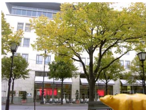
Abgeordnetenhaus „Unter den Linden 50“