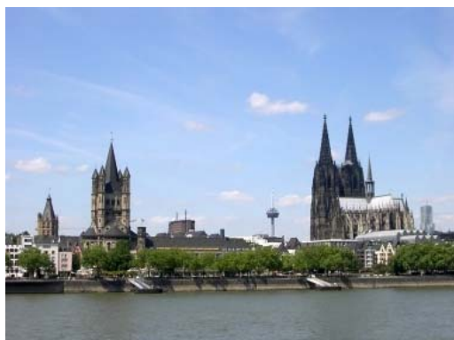
Rheinpanorama mit Blick auf Dom und Altstadt

Zum Bundestagswahlkreis 94 (Köln I) gehören die Kölner Stadtbezirke Porz und Kalk sowie aus dem Stadtbezirk Innenstadt die Stadtteile Altstadt-Nord, Neustadt-Nord und Deutz. Der Wahlkreis reicht damit vom Fernsehturm „Colonus“ über den Dom, das Rathaus und die Kölnarena bis hin zum Flughafen Köln/Bonn. Im Wahlkreis leben über 280.00 Menschen.