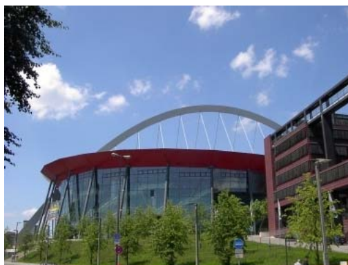
Kölnarena in Deutz