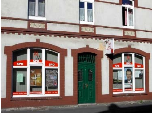
Wahlkreisbüro in Porz