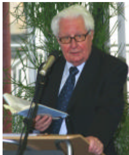
Hans-Jochen Vogel ließ es sich nicht nehmen, selbst einige Buchpassagen vorzutragen

In seinem neuen Buch „Politik und Anstand“ stellt sich Hans-Jochen Vogel den Fragen des Journalisten Heribert Prantl zu seinem politischen Wirken und der Bedeutung von Werten in der Politik.