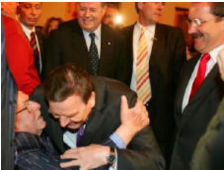
Herzliche Umarmung zwischen Ben Wisch und Gerhard Schröder beim Einzug

Der Kölner Express gab die Stimmung im Saal so wieder: „Es war ein euphorischer Empfang, den die 1.400 Gäste im Gürzenich dem Bundeskanzler bereiteten. Gerhard Schröder wurde beim politischen Aschermittwoch so bejubelt, wie es im letzten Jahr selbst Genossen nicht mehr für möglich gehalten haben ... Die Reden der drei Sozi-Gladiatoren (Schröder, Steinbrück und Schartau) wurden immer wieder von Jubel unterbrochen. „Ich habe immer gesagt, dass die Stimmung wieder für die SPD ausschlagen wird“, sagte Ben Wisch nach der Rede des Kanzlers. „Wichtig ist Durchhaltevermögen.“