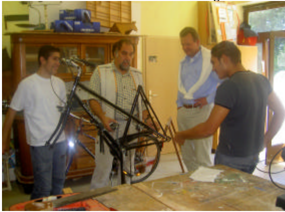
In der Werkstatt lernten die Schüler gerade, ein Fahrrad zu reparieren

Die Gäste sahen sich mehrere Unterrichtsräume an, in denen die Schülerschaft handwerklich geschult wird.