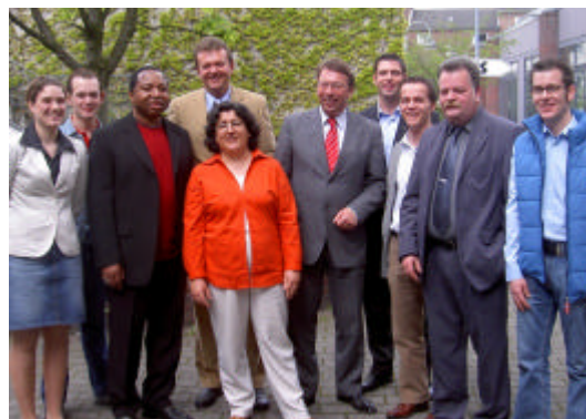
Klaus Uwe Benneter kam zum Frühjahrsempfang in Kalk