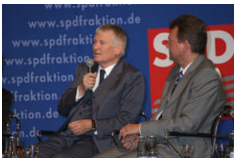
Otto Schily diskutierte im Kölner Gürzenich

Zusammen mit den drei Kölner SPD-Bundestagsabgeordneten Lale Akgün , Martin Dörmann und Rolf Mützenich nahm am 22. April Bundesinnenminister Otto Schily an einer Veranstaltung der SPD-Bundestagsfraktion im Gürzenich teil.