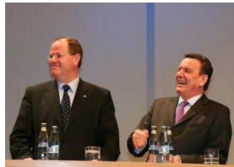
Offensichtlich bestens gelaunt: Steinbrück und Schröder

Die Arbeitslosenzahl von mehr als 5 Millionen sei „bedrückend“ und „treibe jeden von uns um“. Der eingeschlagene Reformweg sei aber richtig. Ansonsten skizzierte der Bundeskanzler eine breite Palette von Themen, angefangen von der Situation im Irak und Iran über die Europapolitik bis hin zu innenpolitischen Themen. Er bekannte sich zum Ziel, die Entwicklungshilfemittel schrittweise bis zu einem Anteil von 0,7% am Bruttoinlandsprodukt bis 2015 zu steigern.