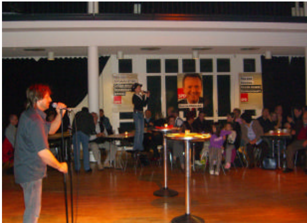
Die Gruppe „Kölsch Blod“ heizte mit einem bunten Strauß kölscher Lieder ein