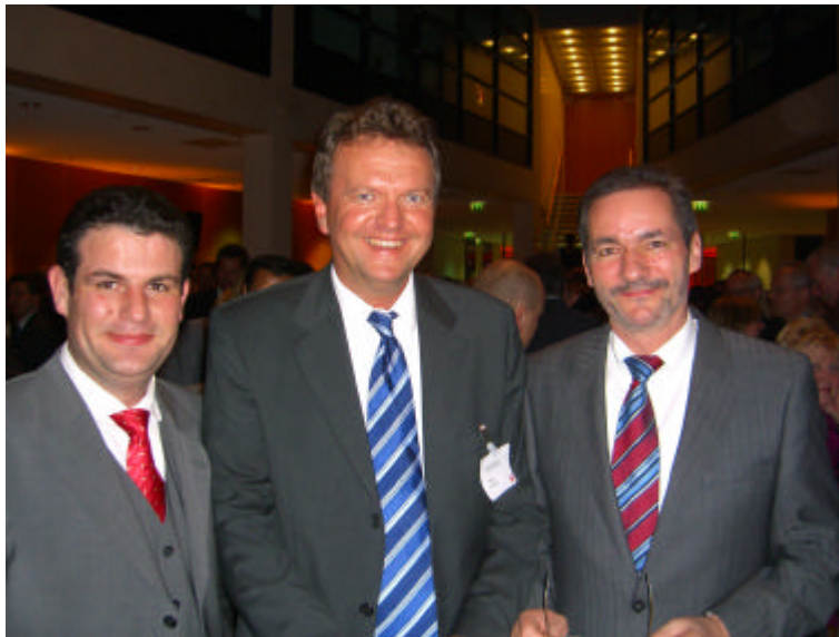
Martin Dörmann mit Generalsekretär Hubertus Heil und dem Parteivorsitzenden Matthias Platzeck bei der Abschiedsfeier der SPD-Bundestagsfraktion für Bundeskanzler Gerhard Schröder

Auch die anderen drei Kölner SPD-Bundestagsabgeordneten sind in der neuen Legislaturperiode Mitglieder in wichtigen Ausschüssen: Lale Akgün im Ausschuss für Angelegenheiten der Europäischen Union, Prof. Karl Lauterbach im Gesundheitsausschuss und Rolf Mützenich im Auswärtigen Ausschuss.