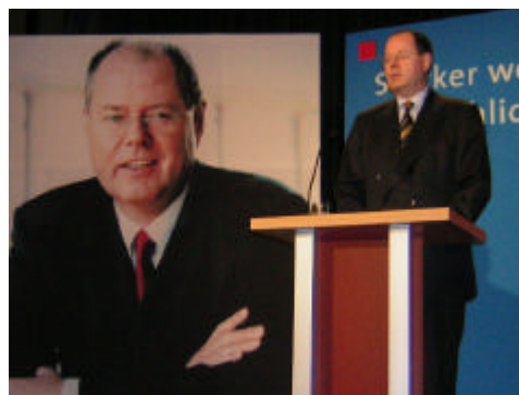
Peer Steinbrück in Porz

Steinbrück verwies auf die erfolgreiche Politik der SPD. Dazu gehöre vor allem der Strukturwandel. So seien beispielsweise heute eine Millionen Menschen im Gesundheitsbereich und 350.000 Menschen im Medienbereich aber nur noch 38.000 im Bergbau beschäftigt. Steinbrück wörtlich: "Dieses Land ist trotz seiner Probleme ein starkes Land."