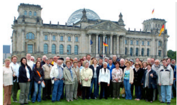
Besucherguppe im Juni

nach der Entscheidung des Bundeskanzlers, Neuwahlen anzustreben. Ausführlich beantwortete der Bundestagsabgeordnete alle ihm gestellten Fragen.