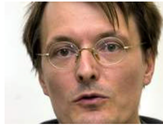
Prof. Karl Lauterbach

Direktor des Instituts für Gesundheitsökonomie an der Universität Köln. SPD-Bundestagskandidat im Wahlkreis Köln-Mülheim/Leverkusen