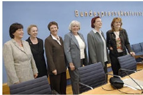
Die Ministerinnen Ulla Schmidt, Kulturstatsministerin Christina Weiss, Brigitte Zypries, Renate Schmidt, Heidemarie Wieczorek-Zeul und Edelgard Bulmahn

haben die Investitionen um fast 40 Prozent, also um fast drei Milliarden Euro erhöht. Wir können unsere internationale Wettbewerbsfähigkeit nur sichern, wenn unsere Menschen zu den bestausgebildeten der Welt gehören. Dafür müssen die Bildungschancen jedes einzelnen erhöht und so die Arbeitslosigkeit wirkungsvoll bekämpft werden.“