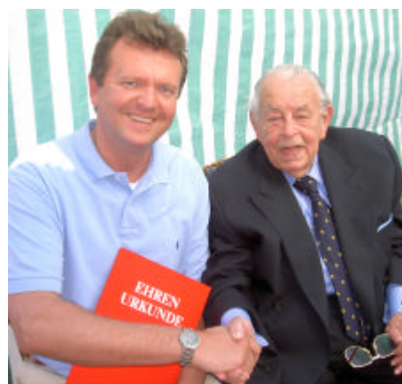
Glückwunsch von Hans-Jürgen Wischnewski

Hans-Jürgen Wischnewski ging auch auf die aktuelle politische Diskussion ein und meinte, die Reformen der Agenda 2010 seien richtig. Leider würde viel zu wenig darauf hingewiesen, dass gerade die besonderen Kostenbelastungen durch die deutsche Einheit den Handlungsspielraum des Staates immer weiter eingeengt hätten.