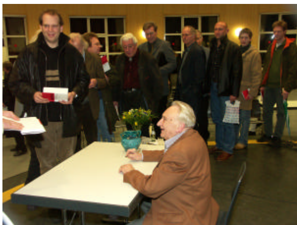
Nach Abschluss der Veranstaltung bildete sich eine lange Schlange von „Autogrammjägern“