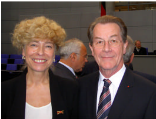
Es war eine knappe Wahl. Gespannte Erwartung des Ergebnisses während der Bundesversammlung bei Gesine Schwan und Franz Müntefering...