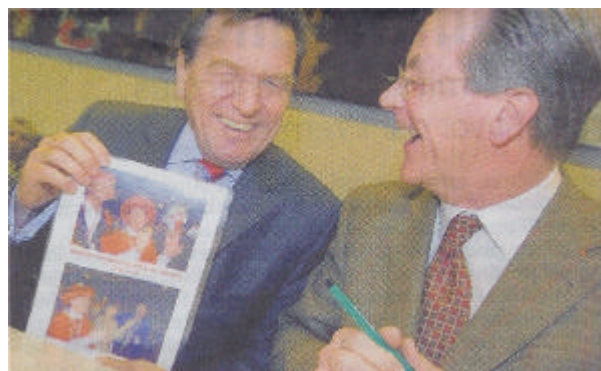
Spaß vor der Fraktionssitzung